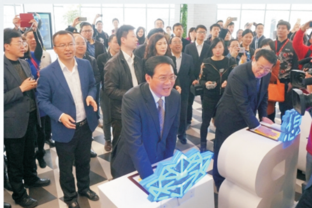
省长李强调研梦想小镇

余杭梦想小镇位于杭州未来科技城（海创园），筹建于2014年8月，规划面积3平方公里，是省市针对互联网创业专门搭建的综合服务平台，致力于打造众创空间新样板、特色小镇新范式，形成信息经济的新增长点和互联网创业创新高地。