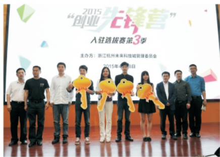
创业先锋营第三季

依托坐拥阿里、紧邻浙大、立足浙商的资源优势，一支以海归系、阿里系、浙大系、浙商系为代表的创新创业“新四军”在这里不断集结，快速壮大。初步建成了极客创业营、湾西加速器、浙大校友孵化器、纵贯加速器等十余个各具特色的孵化平台，一个低成本、全要素、开放式、便利化的创业社区基本建成。