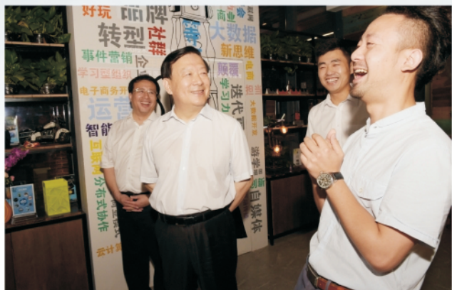
省委书记夏宝龙调研梦想小镇